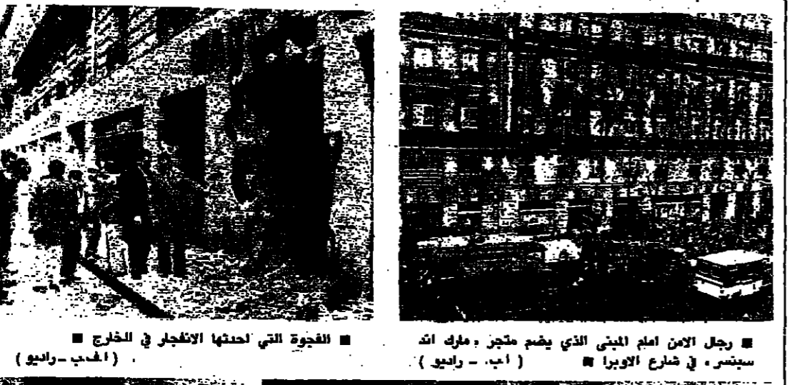
رجل الامن امام البني الذي يضم متجر مارك اندسنس في شارع الاوبرا

الانوار في لبنان: ٦٠٠ ليل في بيروت: ٨٠٠ ليل في طرابلس: ٧٠٠ ليل في صور: ٦٠٠ ليل في النبطية: ٦٠٠ ليل في زحلة: ٦٠٠ ليل في البعلبعل: ٦٠٠ ليل في طبريا: ٦٠٠ ليل في حاصبيا: ٦٠٠ ليل في راشيا: ٦٠٠ ليل في الكسروانية: ٦٠٠ ليل في عكا: ٦٠٠ ليل في حيفا: ٦٠٠ ليل في الناصرة: ٦٠٠ ليل